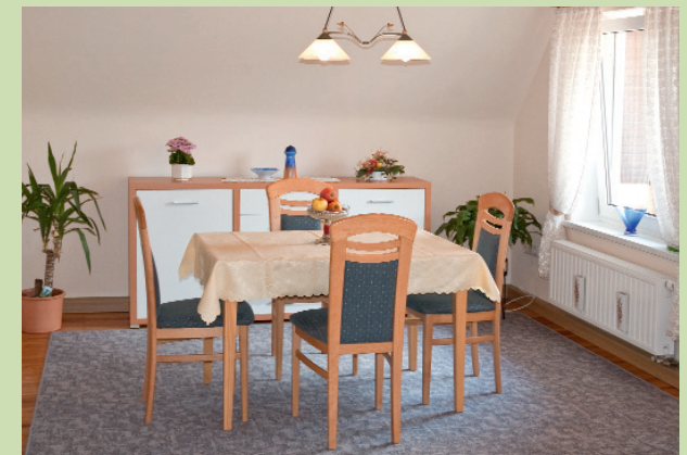
Essecke im Wohnzimmer