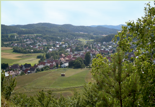
Blick vom Hartenfels auf Neukirchen