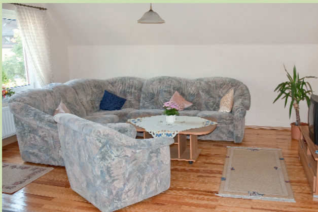
Couchecke im Wohnzimmer