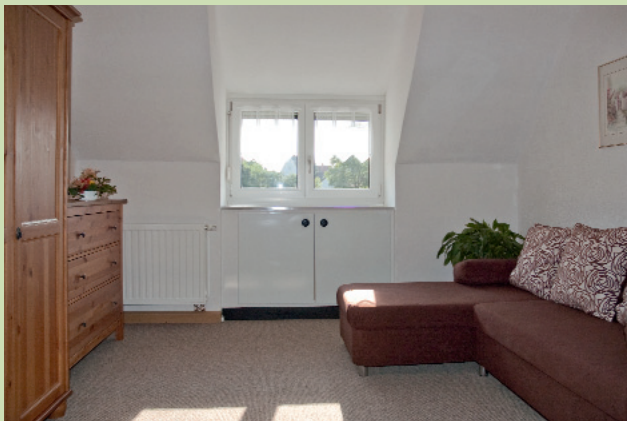
Zimmer mit Schlafcouch