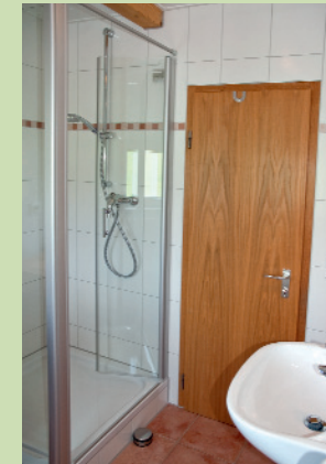
Duschbad mit WC