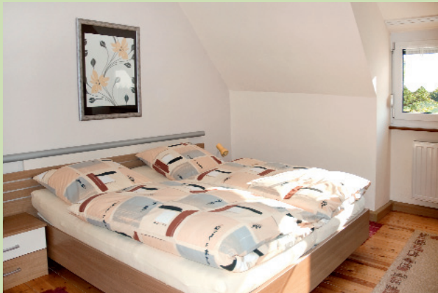
Schlafzimmer mit Doppelbett